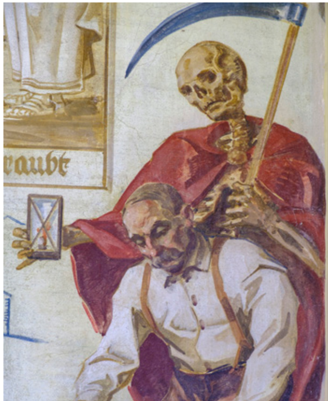
Bauer und der Tod als Sensesmann, Fresko in den Arkaden im Stadtpark, ehemaliger Friedhof, Schwaz, Inntal, Tirol.

Tatsächlich gab es ein nächstes Mal, rund drei Jahre später. Schon kurz nach sieben Uhr saßen wir in der ersten Musik-Bar. Der Abend zog sich wie ein Kaugummi. Statt das unbegrenzte Vergnügen