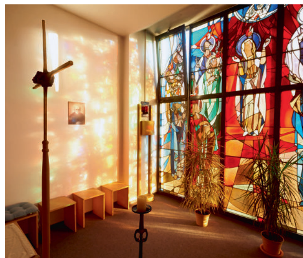
Kapelle am »Lernort Vallendar«.