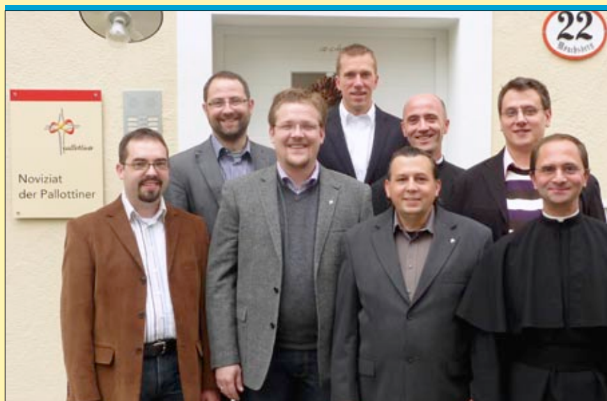
Mehr Leben, mehr Gemeinschaft, mehr Abwechslung: Mit den Neuzugängen hat sich die Noviziatsgemeinschaft auf einen Schlag verdoppelt.