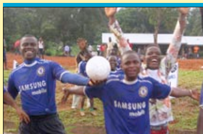
Stürmischer Jubel: Die jungen Pallottiner feiern ihren Sieg beim ersten interkonfessionellen Fußballturnier in Mbaukwu.

Denn das Kameruner Beispiel zeigt, wie die Zahl der Brüder wächst, die dann als Schreiner oder als Grundschullehrer in pallottinischen Einrichtungen arbeiten. »Jedes Jahr melden sich rund 150 potenzielle