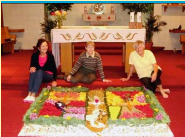
Engagierte Laienmitarbeit: Mit Traditionen aus Deutschland, wie der Blumentepich zu Fronleichnam, werden Brücken in fremde Kulturen gebaut.

Das fängt an bei der Theatergruppe, geht über den Kirchenchor und endet beim gemütlichen Grillfest am See. Laien zu ermutigen, im Leben der Gemeinde Verantwortung zu übernehmen, gehört hier wie selbstverständlich dazu. Und davon zeugt nicht nur der Kirchbau vor fünfzig Jahren, der in weiten Teilen durch Eigenleistung der Pfarreimitglieder ausgeführt wurde. Gemeinschaftliche Aktionen, die ihren Teil dazu beitragen, dass aus Pfarrgemeinden echte Pfarrfamilien wurden. Eine Realität, die ohne muttersprachliche Seelsorger in den Gemeinden und ohne die Unterstützung aus dem Auslandssekretariat in Bonn anders aussehen würde. Nis