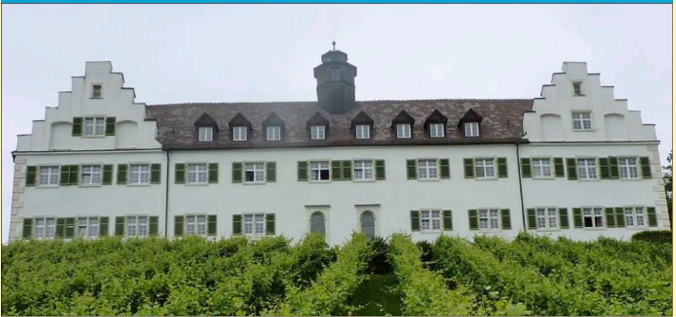
Wahrhaft gastlich und geistlich: Hinter den dicken Mauern erwartet die Gäste von Schloss Hersberg eine lebendige Hausgemeinschaft.