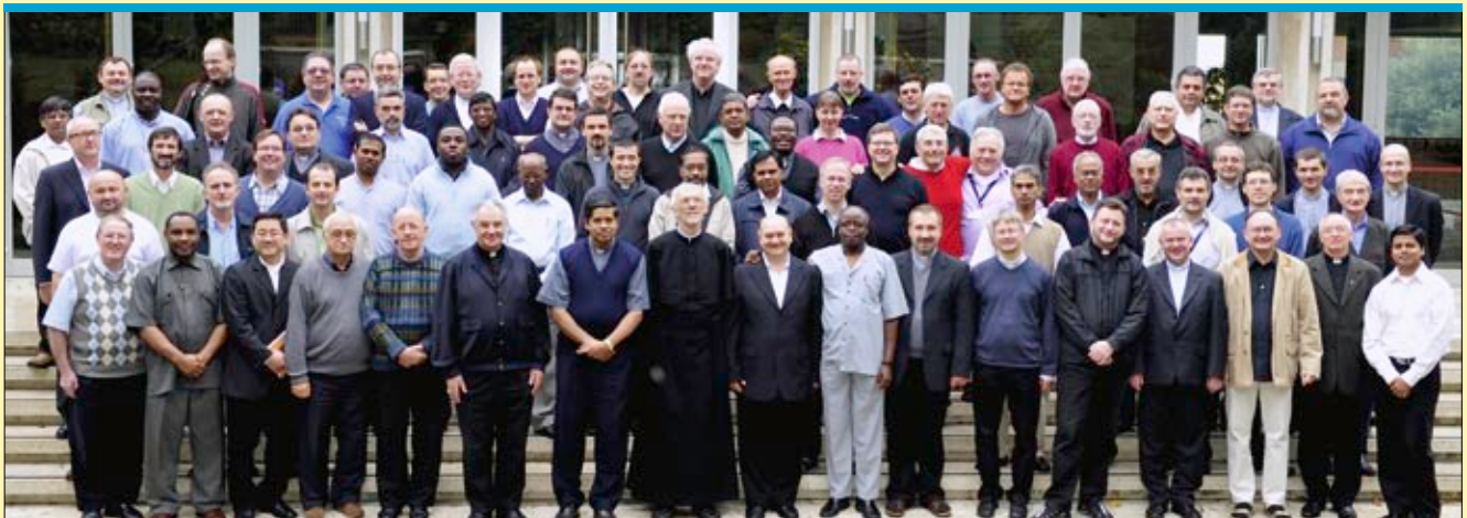
Die Wahl der neuen Generalleitung, die internationale Vernetzung, das Selbstverständnis als Priester- und Brüdergemeinschaft und das Leben der Unio waren zentrale Punkte, mit denen sich die Delegierten der Generalversammlung auseinandersetzten.

Die Generalversammlung beschäftigte sich mehrere Tage mit der Frage, wie das Grundanliegen Vinzenz Pallottis, den Glauben zu vertiefen und zu beleben, heute verwirklicht werden kann. Die für den Glauben