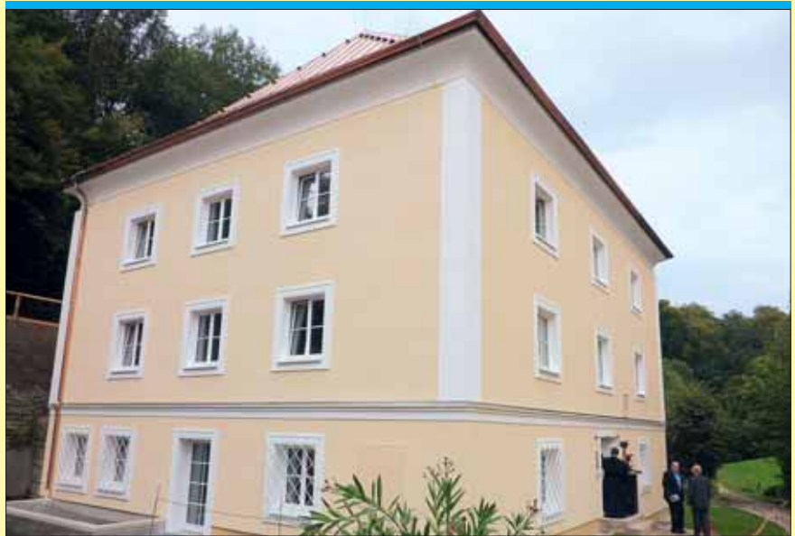
Erstrahlt in frischem Glanz: Nach nur einem halben Jahr Bauzeit kann die Hausgemeinschaft ihr neues Noviziatshaus auf dem Mönchsberg beziehen.